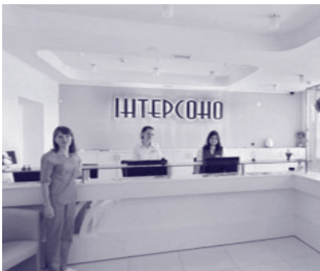
Компанія "Інтерсоно" вийшла на нові ринки та запустила нову продукцію.

Ми допомогли "Інтерсоно" у роботі з місцевим консультантом, який спеціалізується на питаннях управління людськими ресурсами (HR), для розробки