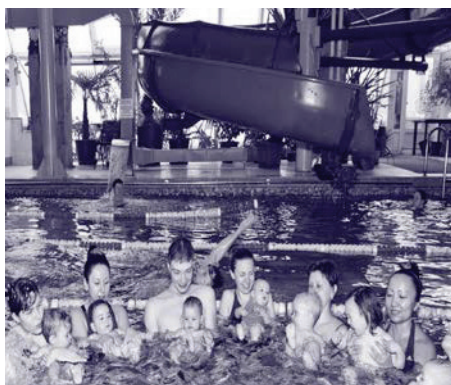
Реалізація комплексного проекту із застосування енергозберігаючих технологій дозволить зменшити витрати компанії «Аква-спорт» на енергоносії на 50%.

Ми допомогли компанії «Аква-спорт» знайти консультанта, який розробив проектну документацію із застосування енергозберігаючих технологій для того, щоб обладнання, яке забезпечує роботу підприємства, працювало в оптимальних